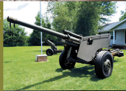
HET M5 ANTITANKKANON