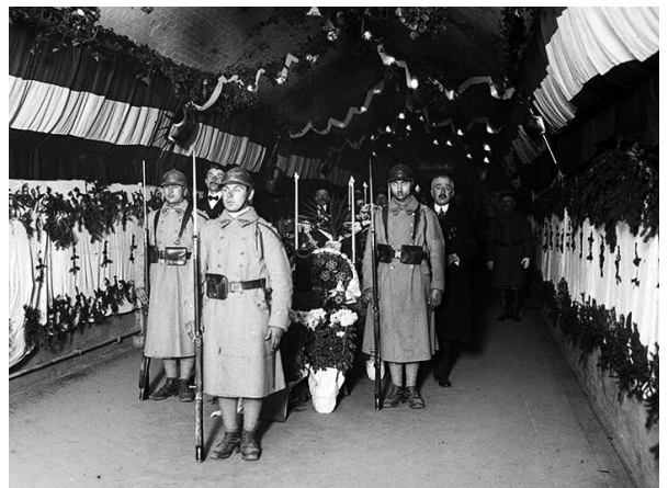
8 kisten staan opgesteld in de Citadel van Verdun